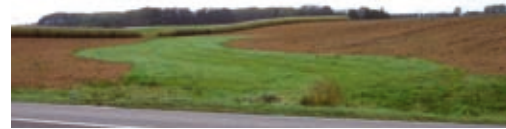
Le rayage doit atteindre la zone enherbée...