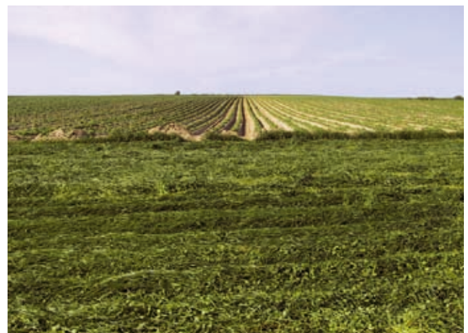
Enrubannage sur un bout de champ enherbé à base de ray-grass et de trèfle

Si votre zone enherbée est trop envasée, l'eau risque de passer à côté. Déplacez-la ou reprofilez-la pour qu'elle continue à être pleinement efficace.