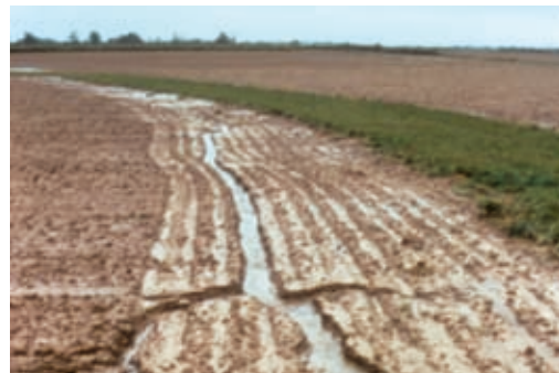
...sinon une rigole se creuse !