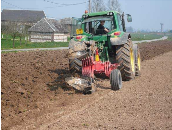
Labour de la fourrière

Itinéraire : labour en début de semaine suivi d'un passage de préparation de semis (outils à l'avant et à l'arrière du tracteur avec une grande combinaison d'éléments différents) puis un passage avec le semoir et des croskillettes localisées à l'avant du tracteur. Cette année un second passage avec l'outil de préparation est réalisé juste avant le semis, car il y a des mottes dures.